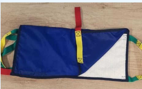
Obrázek 2 – Podložka na přesun pacienta