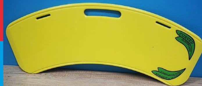
Obrázek 4 – Přesuvná deska

Pozor – židle musí být pevná a zajištěná tak, aby se nepohybovala.