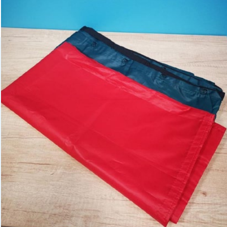
Obrázek 1 – Kluzná podložka