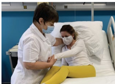
Obrázek 3 – Posazování klienta na lůžku