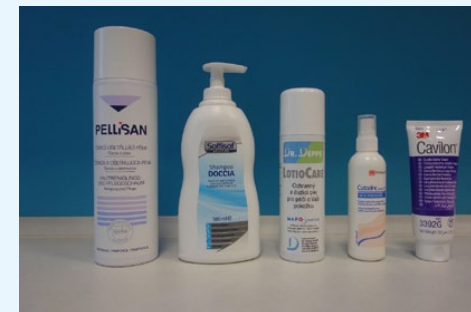
Obrázek 1 – Přípravky k hygienické péči a ochraně pokožky