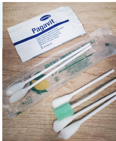
Obrázek 2 – Vlhčené štětičky ke specifické péči o dutinu ústní