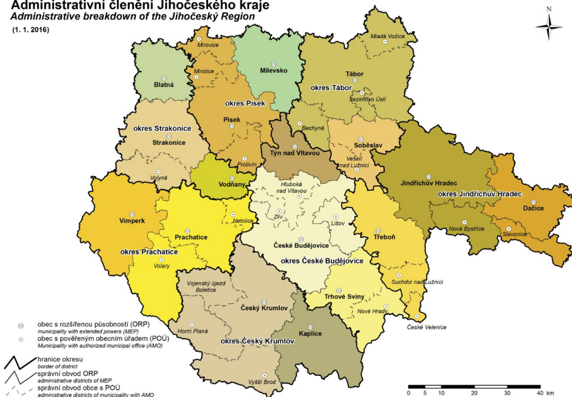
Obrázek 2 – Mapa administrativního členění kraje