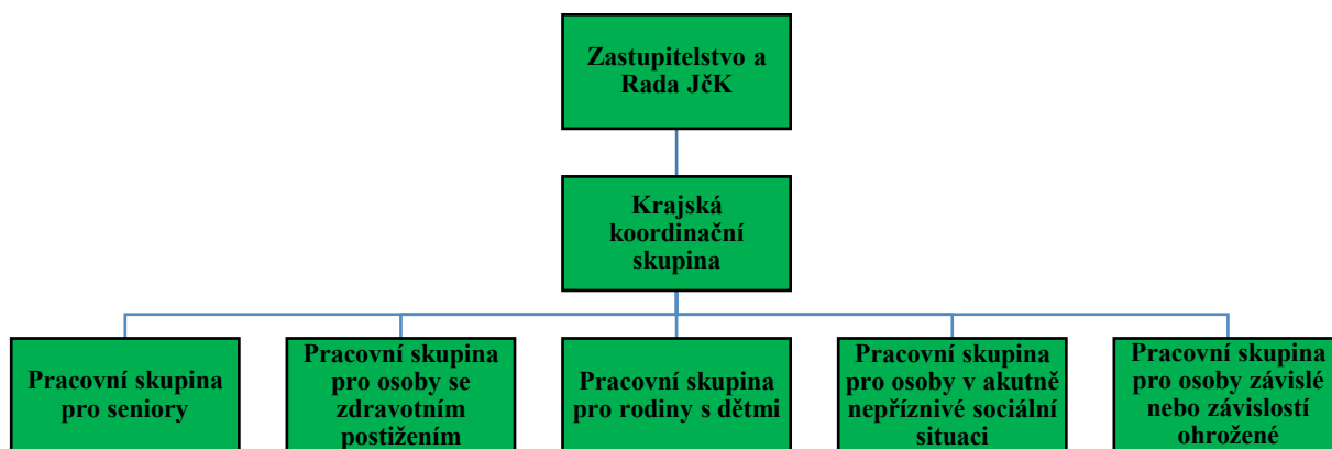
Obrázek 1 – Organizační struktura SPRSS

Návrh organizační struktury byl vytvořen na základě zkušeností s tvorbou předchozích SPRSS Jihočeského kraje, ve spolupráci s metodiky plánování sociálních služeb.